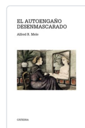
AUTOENGAÑO DESENMASCARADO ALFRED R. MELE