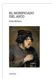
SIGNIFICADO DEL ASCO COLIN MCGINN