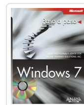
WINDOWS 7 JOAN PREPPERNAU