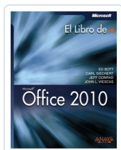
OFFICE 2010 ED BOTT