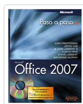
OFFICE 2007 JOAN PREPPERNAU