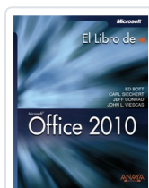
OFFICE 2010 ED BOTT