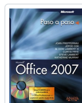
OFFICE 2007 JOAN PREPPERNAU