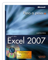
EXCEL 2007 CURTIS FRYE