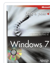
WINDOWS 7 JOAN PREPPERNAU