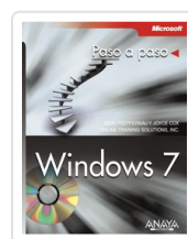
WINDOWS 7 JOAN PREPPERNAU