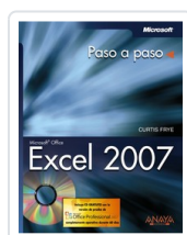
EXCEL 2007 CURTIS FRYE