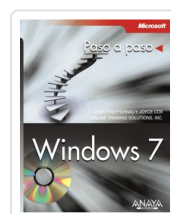
WINDOWS 7 JOAN PREPPERNAU