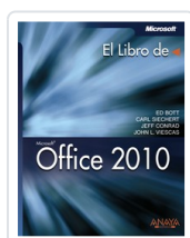
OFFICE 2010 ED BOTT