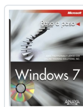
WINDOWS 7 JOAN PREPPERNAU