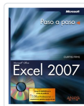
EXCEL 2007 CURTIS FRYE