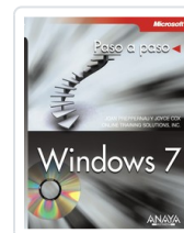
WINDOWS 7 JOAN PREPPERNAU