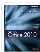
OFFICE 2010 ED BOTT