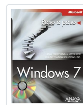
WINDOWS 7 JOAN PREPPERNAU