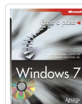
WINDOWS 7 JOAN PREPPERNAU