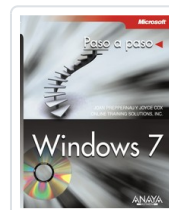
WINDOWS 7 JOAN PREPPERNAU