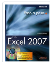
EXCEL 2007 CURTIS FRYE