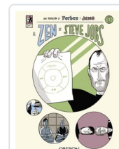
ZEN DE STEVE JOBS FORBES