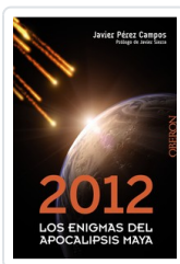
2012. LOS ENIGMAS DEL APOCALIPSIS MAYA JAVIER PEREZ CAMPOS