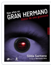
DIEZ AÑOS EN GRAN HERMANO. DIARIO DE UNA GUIONISTA GILDA SANTANA