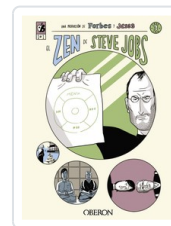
ZEN DE STEVE JOBS FORBES