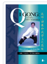
QIGONG SALUD Y ARTES MARCIALES YANG, JWING-MING