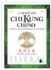
LA RAÍZ DEL CHI KUNG CHINO YANG, JWING-MING