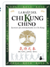
RAIZ DEL CHI KUNG CHINO YANG, JWING-MING