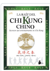
LA RAÍZ DEL CHI KUNG CHINO YANG, JWING-MING