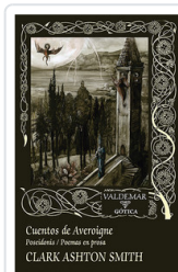
CUENTOS DE AVEROIGNE. POSEIDONIS / POEMAS EN PROSA SMITH, CLARK ASHTON