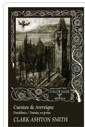
CUENTOS DE AVEROIGNE. POSEIDONIS / POEMAS EN PROSA SMITH, CLARK ASHTON