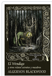
WENDIGO Y OTROS RELATOS EXTRAÑOS Y MACABROS BLACKWOOD, ALGERNON