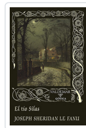
TIO SILAS, EL LE FANU, JOSEPH SHERIDAN