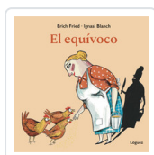
EQUIVOCO FRIED, ERICH