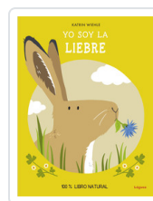
YO SOY LA LIEBRE WIEHLE, KATRIN