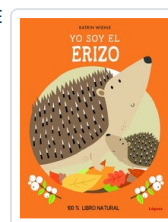
YO SOY EL ERIZO WIEHLE, KATRIN