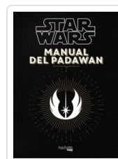
MANUAL DEL PADAWAN NICOLAS BEAUJOUAN