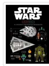
STAR WARS GRAPHICS HACHETTE HEROES