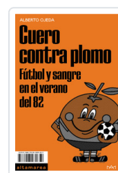
CUERO CONTRA PLOMO. FUTBOL Y SANGRE EN EL VERANO DEL 82 OJEDA, ALBERTO