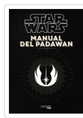
MANUAL DEL PADAWAN NICOLAS BEAUJOUAN