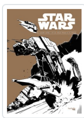
STAR WARS. EL GRAN LIBRO DE LA SAGA PARA COLOREAR HACHETTE HEROES