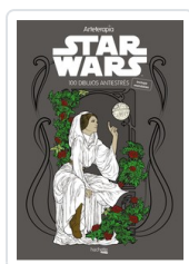
ARTETERAPIA. STAR WARS HACHETTE HEROES