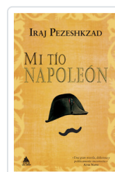
MI TIO NAPOLEON PEZESHKZAD, IRAJ