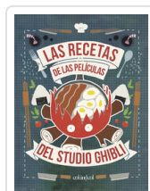
RECETAS DE LAS PELICULAS DEL STUDIO GHIBLI, LAS VO, MINH-TRI