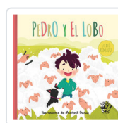
PEDRO Y EL LOBO (EL PASTOR MENTIROSO) AA.VV.