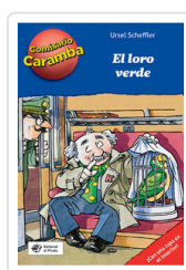
COMISARIO CARAMBA, 4 LORO VERDE SCHEFFLER, URSEL