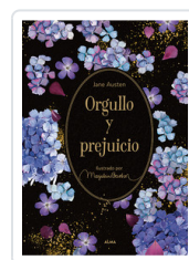
ORGULLO Y PREJUICIO (EL JARDIN SECRETO) AUSTEN, JANE