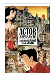
ACTOR ASPIRANTE - INTEGRAL MAX VENTO