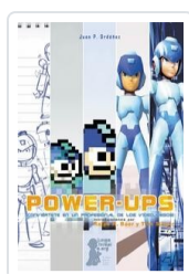
POWER UPS ORDÓÑEZ, JUAN P.