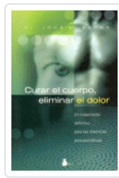
CURAR EL CUERPO ELIMINAR DOLOR SARNO, JOHN