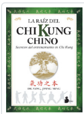
LA RAÍZ DEL CHI KUNG CHINO YANG, JWING-MING