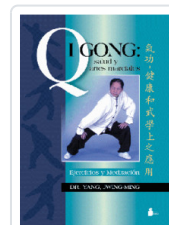
QIGONG SALUD Y ARTES MARCIALES YANG, JWING-MING