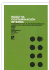
NUESTRA CONTAMINACION INTERNA PORTA, MIQUEL