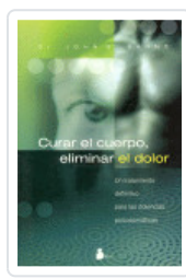
CURAR EL CUERPO ELIMINAR DOLOR SARNO, JOHN