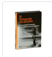
FOTOGRAFO DE BOLSILLO, EL KUS, MIKE