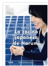
COCINA JAPONESA DE HARUMI, LA KURIHARA, HARUMI