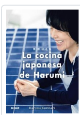
COCINA JAPONESA DE HARUMI, LA KURIHARA, HARUMI