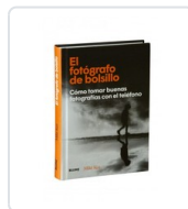
FOTOGRAFO DE BOLSILLO, EL KUS, MIKE