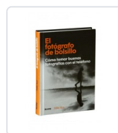
FOTOGRAFO DE BOLSILLO, EL KUS, MIKE