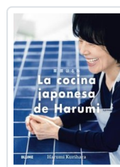
COCINA JAPONESA DE HARUMI, LA KURIHARA, HARUMI