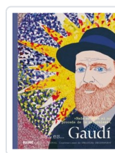
ASI ES... GAUDI CLAYPOOL/ CHRISTOFOROU