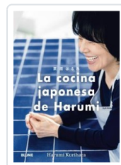
COCINA JAPONESA DE HARUMI, LA KURIHARA, HARUMI