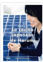
COCINA JAPONESA DE HARUMI, LA KURIHARA, HARUMI