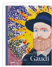
ASI ES... GAUDI CLAYPOOL/ CHRISTOFOROU