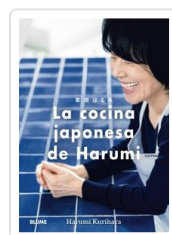
COCINA JAPONESA DE HARUMI, LA KURIHARA, HARUMI