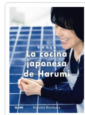
COCINA JAPONESA DE HARUMI, LA KURIHARA, HARUMI