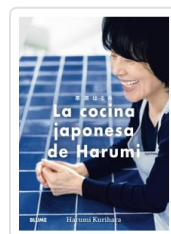
COCINA JAPONESA DE HARUMI, LA KURIHARA, HARUMI