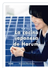
COCINA JAPONESA DE HARUMI, LA KURIHARA, HARUMI