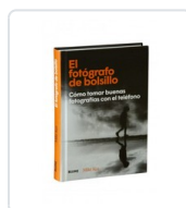
FOTOGRAFO DE BOLSILLO, EL KUS, MIKE