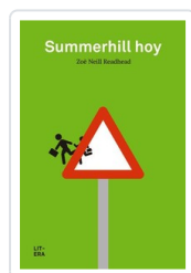
SUMMERHILL HOY NEILL, ZOE