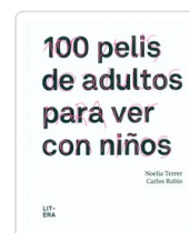
100 PELIS DE ADULTOS PARA VER CON NIÑOS TERRER, NOELIA