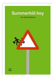
SUMMERHILL HOY NEILL, ZOE