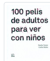
100 PELIS DE ADULTOS PARA VER CON NIÑOS TERRER, NOELIA