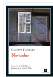
NOVIEMBRE FLAUBERT, GUSTAVE