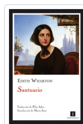
SANTUARIO WHARTON, EDITH